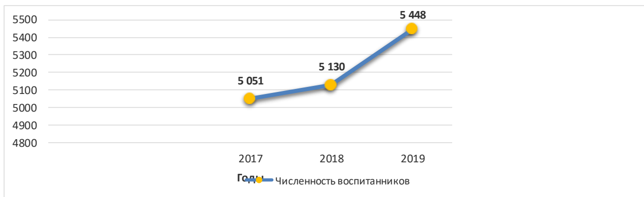
Рисунок 1 – Численность воспитанников образовательных организаций, осуществляющих образовательную деятельность по образовательным программам дошкольного образования, в чел.

В 2019 году численность воспитанников образовательных организаций, осуществляющих образовательную деятельность по образовательным программам дошкольного образования, составляла 5448 человек, что на 318 человек больше в сравнении с 2018 годом (рисунок 1). В процентном выражении прирост составил 5,83 %. Прирост относительно 2018 года составил 1,5%.