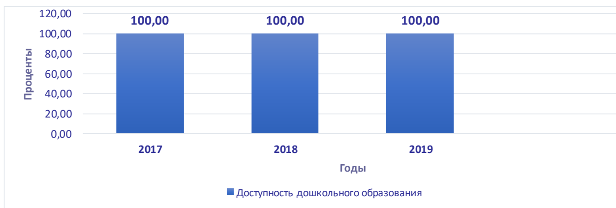
Рисунок 2. Рост доступности дошкольного образования, в %

В 2019 году численность воспитанников образовательных организаций, осуществляющих образовательную деятельность по образовательным программам дошкольного образования, составляла 5448 человек, что на 318 человек больше в сравнении с 2018 годом (рисунок 1). В процентном выражении прирост составил 5,83 %. Прирост относительно 2018 года составил 1,5%.