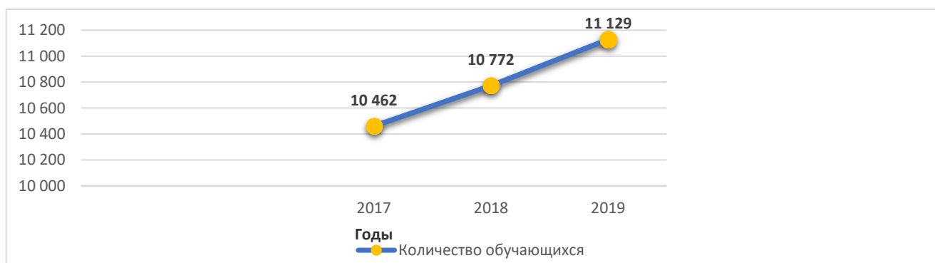
Рисунок 4. Количество обучающихся 1-11 классов общеобразовательных учреждений г. Ессентуки, в чел.

В 2019 году в образовательных организациях города Ессентуки, реализующих образовательные программы начального общего, основного общего и среднего общего образования, обучалось 11 129 человек, что на 357 человек (3,2 %) больше относительно 2018 года.